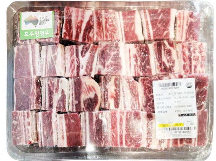
냉동 본갈비찜(호주산 우육)