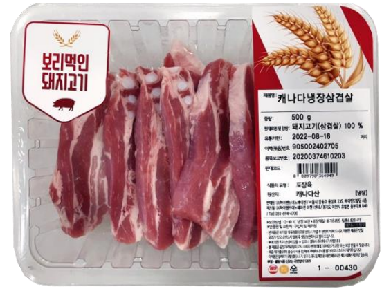
냉장 삼겹살(캐나다산 돈육)