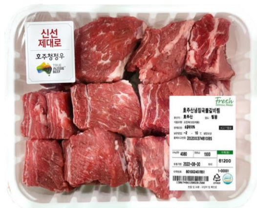
냉장 갈비찜(호주산 우육)