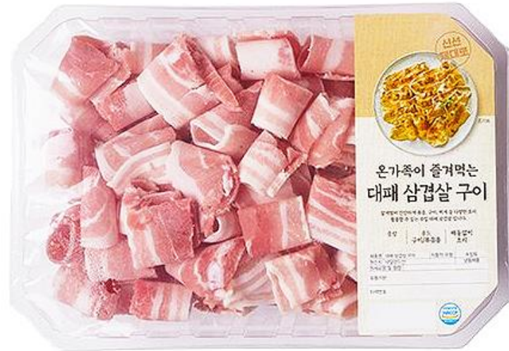
냉동 대패삼겹살(네덜란드산 돈육)