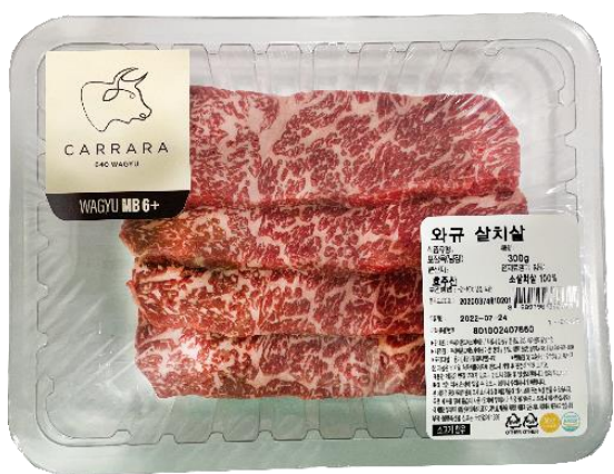
냉장 와규살치살(호주산 우육)